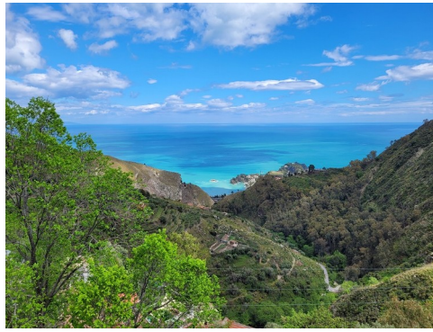
Bucht von Taormina