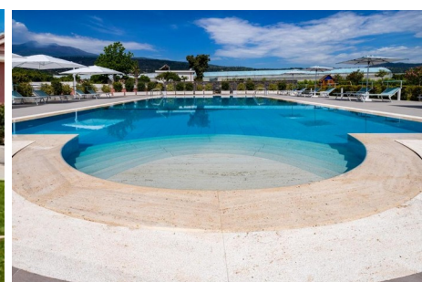
Dipladenia Garden Country House in Mascali, Sizilien