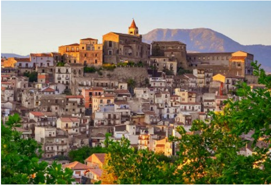
Castiglione di Sicilia